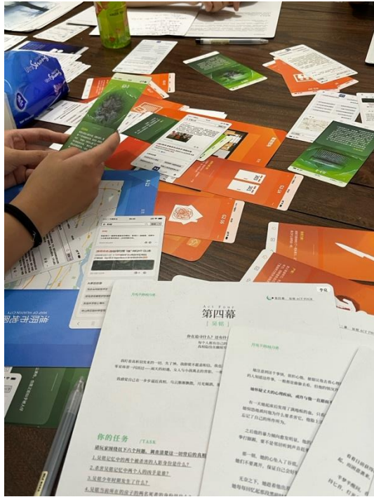
剧本杀体验工作坊，玩家剧本与线索。