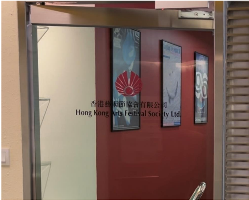
香港艺术节协会公司正门